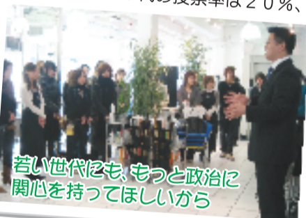
若い世代をも、もっと政治に関心を持ってほしいから

しかしながら、悲しいことに、世代別の投票率は大体、その年代と近い値になっています。20代の投票率は20%、30代では30%ぐらいです。どこかの誰かに任すのではなく、自らの責任で、この国、そしてふるさと堺を担っていきませんか?一度、投票所に足を運んでみて下さい。意思表示をすることが、自分達の将来へと続く道を作っていくこととなります。皆さんの一票は、皆さんにとっても、この街にとっても、大切な大切な一票です。