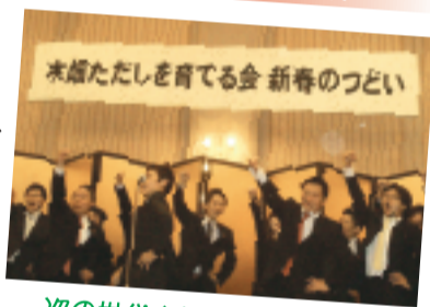
次の世代をしっかりと担うで! 決意をこめて、カンパロー!!

成人式を迎えたばかりの皆さんは、まだまだ政治には関心がないかも知れません。「自分には関係ないわ」と思っている人も数多くいることでしょう。残念ながら、それは錯覚です。遠いところで行われているように思える政治ですが、実は私たちの本当に身近なところで行われているのです。私たちが無関心を決め込んでいる間に、政治の世界では、解決しなければならぬ今の問題を、次の世代、つまり「私たちの世代」へとどんどん先送りしてきます。今、行動を起こさなければ、全てのツケが、私たちに回され続けていきます。