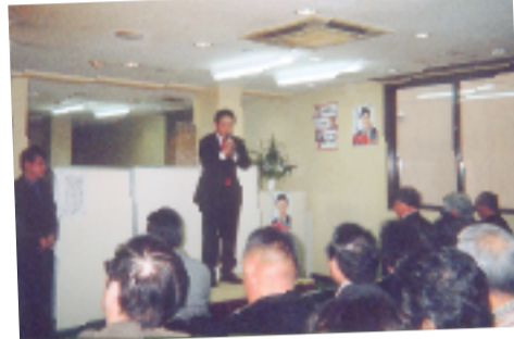
育てる会事務所開き 200人もの応援団の皆さんにお集まり頂きました