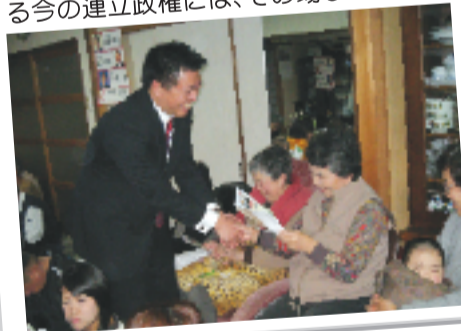
生まれ育って良かった! 長生きして良かった! そんな堺へ!!

これまで、負担を国民に広く分散するという意味での改革はなされてきました。しかし、既得権益を破壊するという意味での改革はまだ充分とはいえません。それはなぜか。戦後60年間続いた自民党政権の中で、いつの間にか既得権益を守るこそそのものが、政治の目的であるかのようになりました。様々な業界、省庁の利権構造を守ることによって、それが出来たからです。様々な業界、省庁の利権構造を守ることによって、それが出来たからです。様々な業界、省庁の利権構造を守ることによって、それが出来たからです。