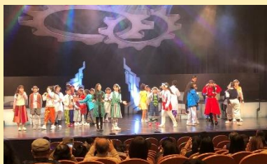
11月1日堺子どもミュージカル

お招き頂いて西区のウェスティホールで開催された劇団Little☆starのミュージカル「READY GO!」を家族と観劇へ。ご縁があって堺市もバックアップしている子どもミュージカル。子どもたちの成長に資する文化事業はこれからもしっかり応援していきます！出演希望等の問い合わせは、072-201-0552（F S アカデミー内）